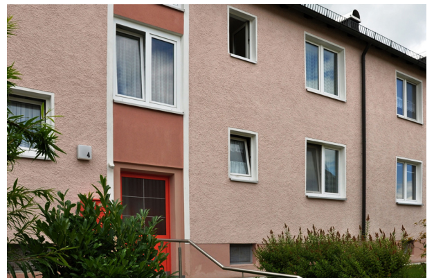
Wohnanlage der Baugenossenschaft in Konradsreuth, Am Lustgarten 4.

Der genossenschaftliche Immobilienbesitz umfasst 84 Wohnungen 1 gewerbliche / sonstige Einheit 48 (Tief-)Garagenplätze